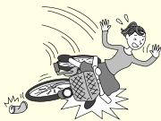
自転車で転倒して ケガをした