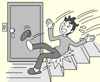
階段から落ちてケガをした