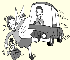
車にはねられてケガをした